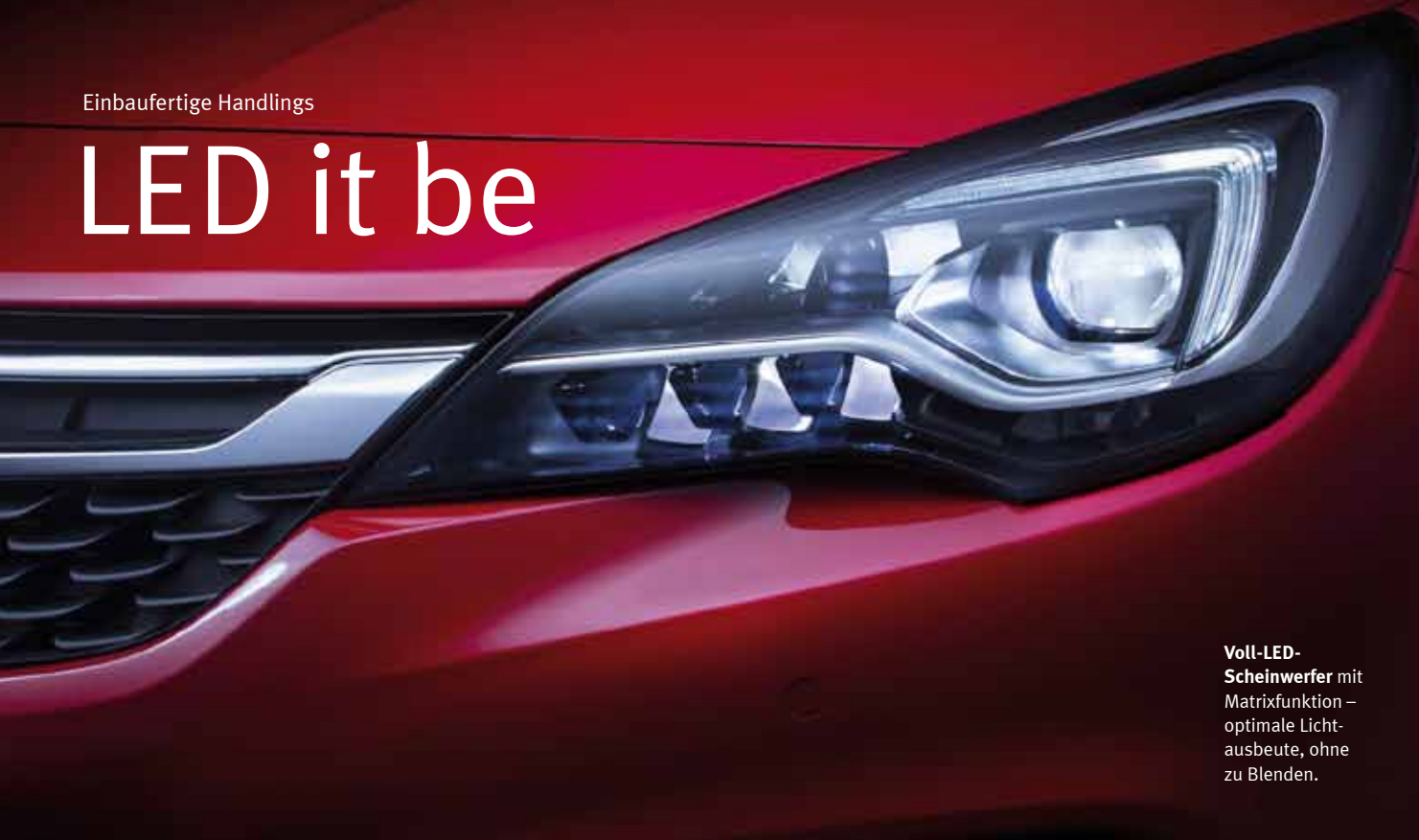
Voll-LED-Scheinwerfer mit Matrixfunktion – optimale Lichtausbeute, ohne zu Blenden.