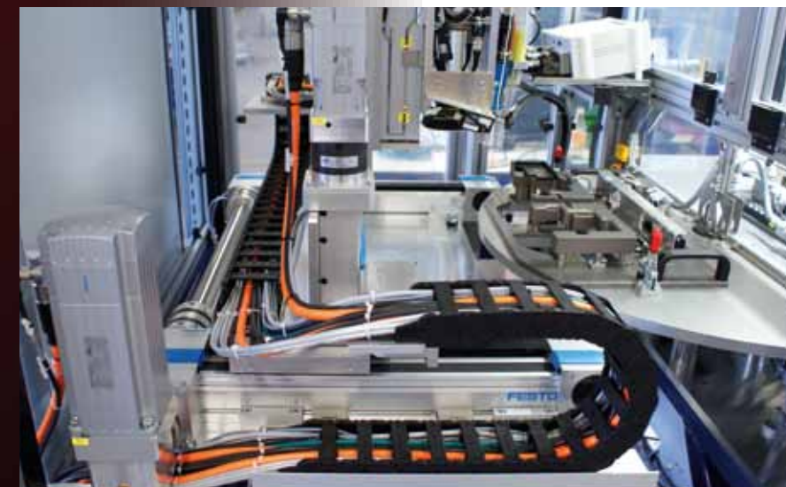
Ein einbaufertig geliefertes Handling sorgt für den gleichmäßigen Auftrag einer 2-Komponenten-Wärmeleitpaste.

Der steirische Anlagenbauer Vescon entwickelte für das Werk eines bekannten Automobilzulieferers in der Slowakei Lösungen für die Herstellung moderner LED-Autoscheinwerfer. Effizientes Handling, korrektes Abarbeiten zeitkritischer Produktionsschritte und die durchgängige Rückverfolgbarkeit standen dabei im Fokus. Mit an Bord: Die Spezialisten des Technic and Applicationcenters von Festo, die für einbaufertige Handlings sorgten.