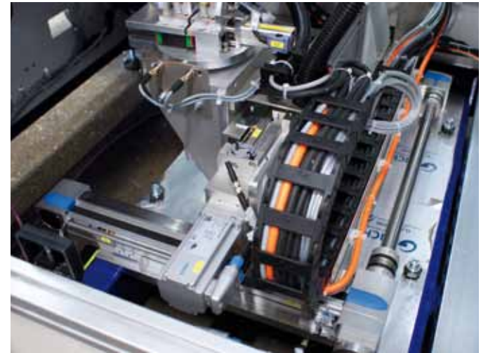
Ein weiteres Handling positioniert Warmnetzköpfe, um die Reflektoren am Kühlkörper zu befestigen.